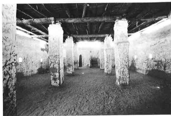
3. Vue intérieure de la mosquée de Fadl Bashir.

2. Plan et coupe de la mosquée de Fadl Bashir. (Dessins T. Kohler et D. Berti).