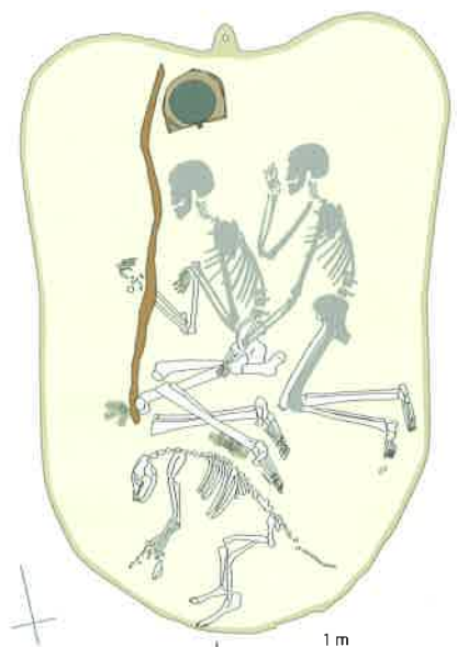
Fig. 3 Tombe double datée vers 2200 av. J.-C. L'inhumé principal est un jeune homme, déposé sur une peau de bovin, avec un chien, un arc, un éventail en plumes d'autruche et un miroir en bronze. Il est accompagné d'une femme de plus de 30 ans dont la main gauche est déposée sur ses hanches. Une partie des squelettes, détruite par les pilliers, a été reconstituée en grisé.

Doppelbestattung auf einer Kuhhaut, um 2200 v.Chr.: Hauptbestattung eines jungen Mannes mit einem Hund, einem Bogen, einem Fächer aus Strausfedern und einem Bronzespiegel – in den Tod begleitet von einer über 30-jährigen Frau, deren linke Hand auf seiner Hüfte ruht. Durch Grabräuber zerstörte Bereiche der Skelette sind in grau gekennzeichnet.